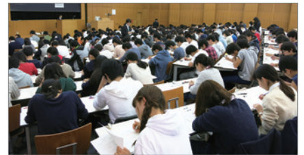
全国統一テスト（小・中・高）を全国で 年2回開催（無料招待）