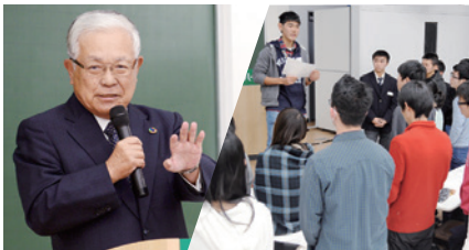
各界トップの視点を学ぶ、究極のモチベーション講座「トップリーダーと学ぶワークショップ」

学力だけでなく、心知体のバランスのとれた「独立自尊の社会・世界に貢献する人財を育成する」ためにナガセの教育ネットワークは、これからも進化を続けます。