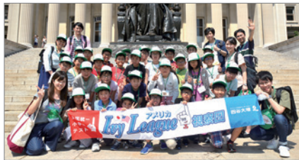
アメリカ Ivy League 視察団 (主催：四谷大塚)