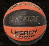
リーガ・エンデサ (スペイン)