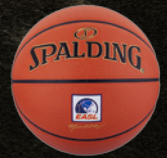
東アジアスーパーリーグ (東アジア)