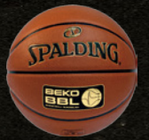
Beko BBL (ドイツ)