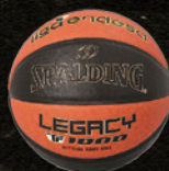
リーガ・エンデサ (スペイン)